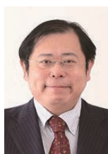
朽木 量 教授