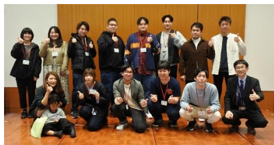
「山武市応援隊」を委嘱された卒業生