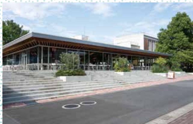
▲The University DINING 前

企画...千葉商科大学「自然エネ100%大学」プロジェクト 協力...真間山弘法寺