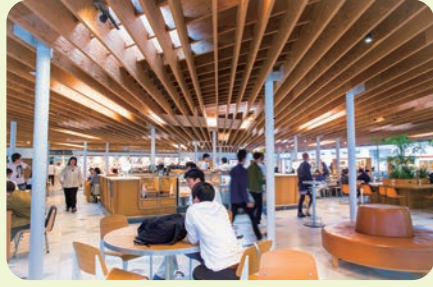
The University DINING

カフェのような感覚で食事を楽しむことができる学生食堂です。学生プロジェクトとタイアップしたメニューの提供や、フードロスや非常食の観点から開発されたレトルト食品の販売も行っています。