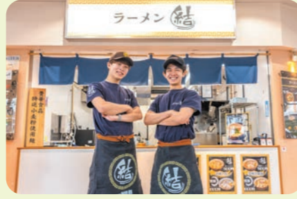
学生ベンチャー食堂

カフェのような感覚で食事を楽しむことができる学生食堂です。学生プロジェクトとタイアップしたメニューの提供や、フードロスや非常食の観点から開発されたレトルト食品の販売も行っています。