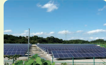
メガソーラー発電所(約4.68ha)

エネルギー資源について考えるきっかけや地域の方々と交流する場を創り、地域活性化に貢献することを目的に、大学100周年に向けたプロジェクト活動の一つとして学内にぶどう畑が誕生しました。