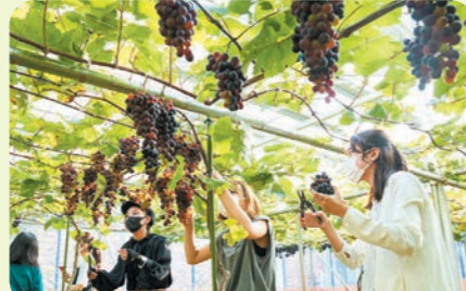
ソーラーシェアリング形式のぶどう畑

2022年に多様性・グローバル化の推進を目的として、学生・教職員が利用できる祈禱室(PrayerRoom)をリニューアルしました。今後もダイバーシティ活動を推進し、誰もが過ごしやすい大学をめざします。