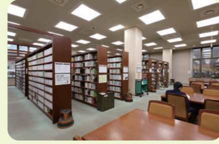
千葉商科大学附属図書館

キャンパス内のスペースを用いて学生が経営を担う学生食堂です。学生自らがプロの飲食店経営者となり、授業で学んだ理論を店舗の運営に活かして、実社会で役立つ経営の知識とノウハウを身につけます。