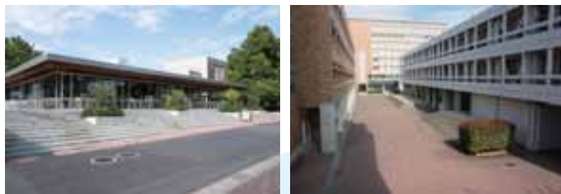
ユニバーシティ・ダイニング前