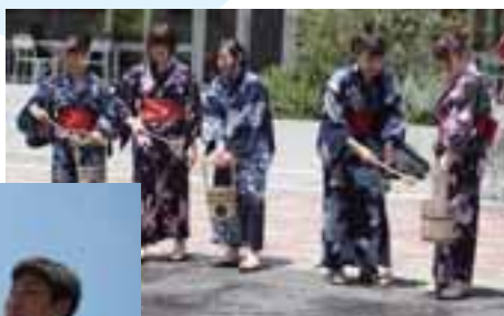
打ち水イベント風景 (2016)