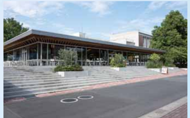
▲ザユニバーシティダイニング前